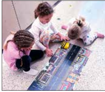
Programmieren auf einer einfachen und spielerischen Stufe: BeeBot, die fahrende und tanzende Biene mit den Kulleraugen.

Das Beste war aber, dass die BeeBots auch zusammen tanzen können.